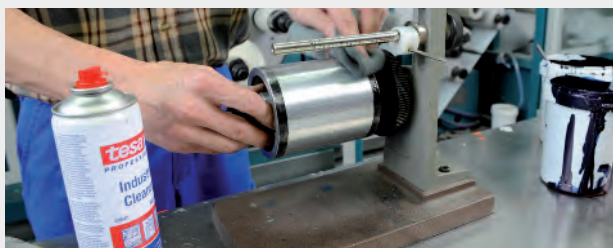
Schnelles und effizientes Reinigen

Professionelles Vorbereiten für ideale Verklebungsergebnisse: