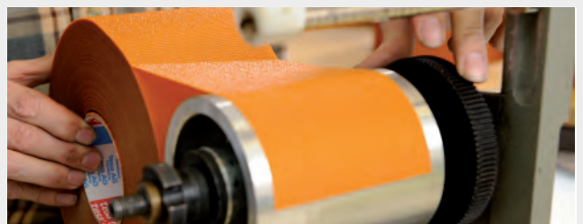
Saubere, fettfreie Oberflächen für optimale Verklebungen